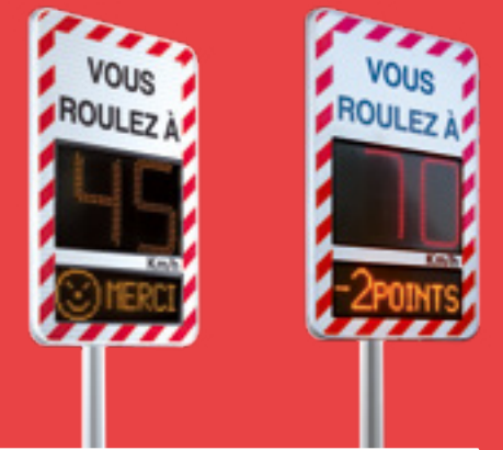
Exemple de configurations et de décors possibles

100 % CONFORME AUX RÉGLEMENTATIONS DU CEREMA 9E PARTIE DE L'IISR* ARTICLE 163