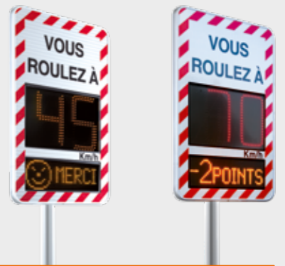
Exemple de configurations et de décors possibles

UNE VÉRITABLE SOLUTION POUR COMBATTRE LES EXCÈS DE VITESSE !